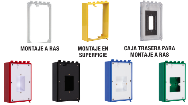
MONTAJE A RAS